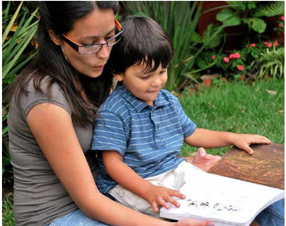
Plus longue est l'interruption, plus dur sera le retour.

Cette même Loi sur la formation professionnelle prévoit le versement de forfaits aux cantons pour qu'ils réalisent toute une série de tâches, telles que décrites dans les articles 53 à 55, mais aussi 31 et 32. Or per-