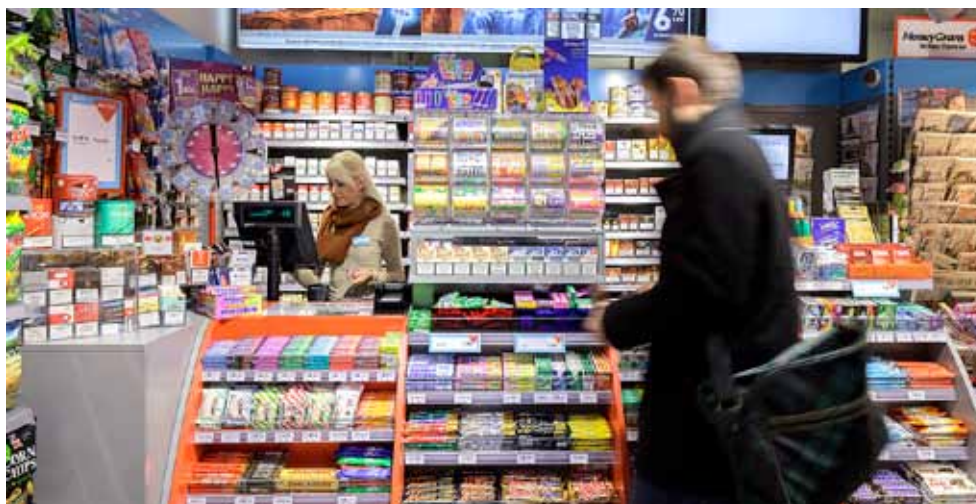
Les contrats d'agence ne pénalisent pas seulement les chefs et cheffes d'agence mais aussi leur personnel.