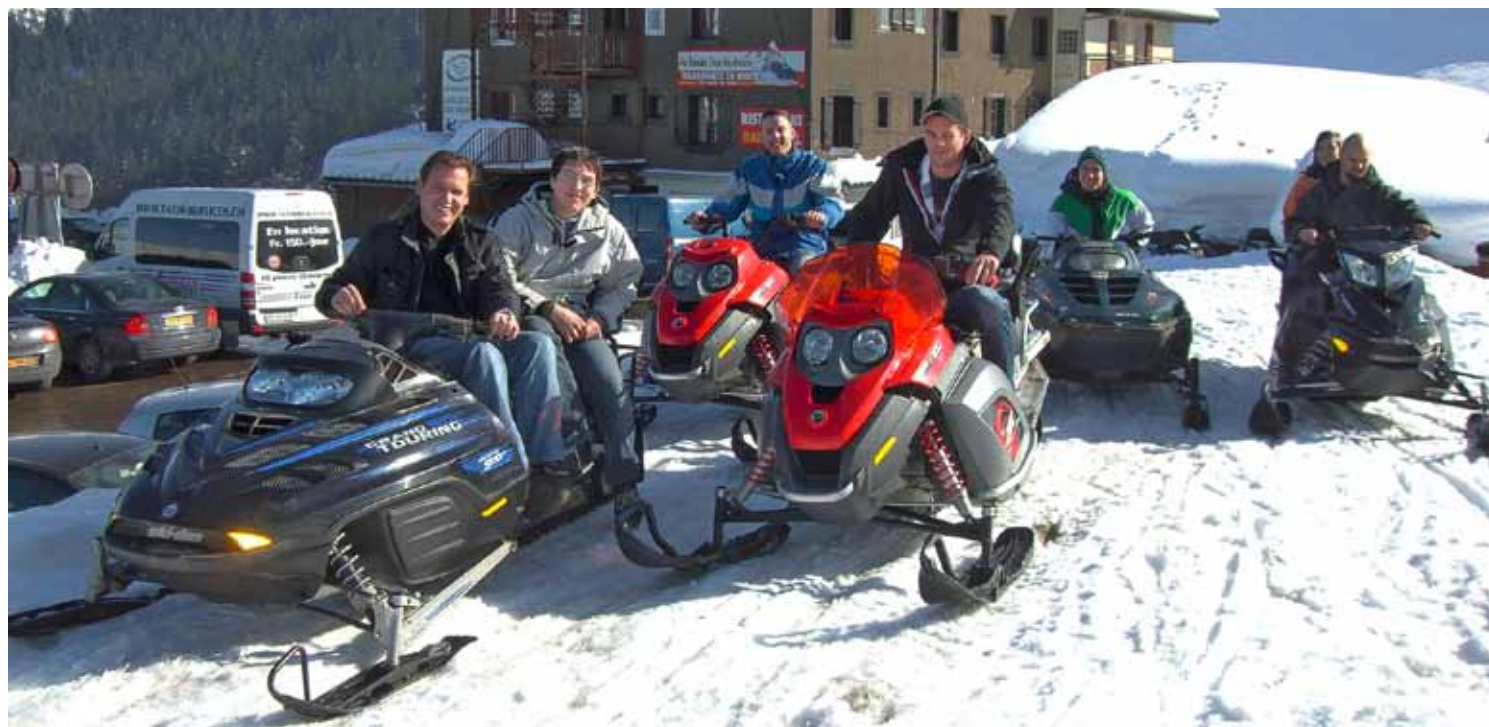
On se familiarise avec les motos.