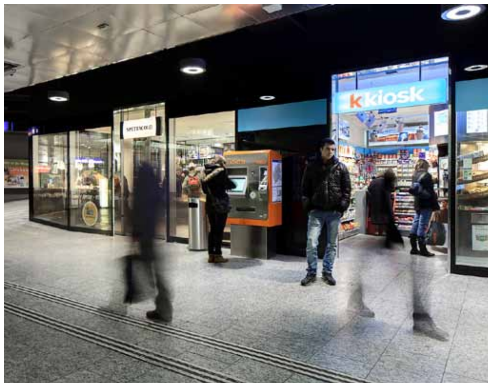
Las condiciones de trabajo de Vendedoras Valora, tanto si es por cuenta ajena o por cuenta propia – todavía tienen que mejorar en algunos aspectos.

Además de los problemas con las agencias también hay informes de casos en los que Valora también ejerce una presión sobre sus términos de tiempo del personal docente. Por lo que trabajadores que trabajan en un salario por hora y una carga de trabajo superior al 60 por ciento tendrían un salario fijo mensual. Para los trabajadores con un salario por hora con una carga de trabajo de 100 por ciento se redujo al 60 por ciento sin contemplaciones. Si bien estas personas todavía tienen que trabajar al 100 por ciento, el otro 40 por ciento se compensaría, pero sólo con el tiempo. Una vez más, las personas que dependen de un trabajo a tiempo completo, fueron empujados a la cabeza, y parece no ser ningún problema para Valora.