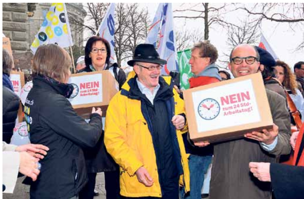
Les signatures référendaires récoltées en peu de temps ont été déposées auprès de la Chancellerie fédérale.

à nouveau prouvé récemment son dédain des avis populaires. Le Conseiller aux Etats Fabio Abate (Radical/TI) revendique une adaptation de la Loi sur le travail aux besoins des touristes étrangers et préconise une extension généralisée des heures d'ouverture des magasins. Et le Conseiller aux Etats PDC tessinois, Filippo Lombardi veut par sa démarche parlementaire que les heures d'ouverture des magasins soient prolongées la semaine jusqu'à 20 heures et le samedi jusqu'à 19 heures. Et maintenant les Verts libéraux demandent que le travail de nuit et du dimanche soit possible pour les petites entreprises de Commerce de détail et de prestations de services. Esso, Shell, Lombardi et Abate doivent ouvrir grandes leurs oreilles. Syna entreprendra tout pour empêcher qu'on poursuive le démantèlement des conditions de travail, du Commerce de détail. Il n'est pas question que des employés et employées doivent travailler jour et nuit à de mauvaises conditions. L'Alliance du dimanche est un regroupement d'organisations ecclésiastiques, de partis de gauche et chrétiens, de syndicats, de fédérations féminines, organismes pour des personnes dépendantes et des médecins du travail. Elle se compose de 26 organisations membres.