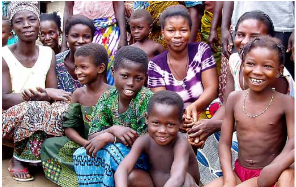
Brücke • Le pont soutient les parents dans leur travail pour qu'ils puissent procurer à leurs enfants ce dont ils ont besoin.

M. Assogba du Sud du Bénin raconte: «Ma sœur a confié sa fille de 8 ans à une cousine qui habite en ville. Depuis 8 mois, elle n'a plus aucune nouvelle et se fait beaucoup de souci. De mon côté, je gagne assez