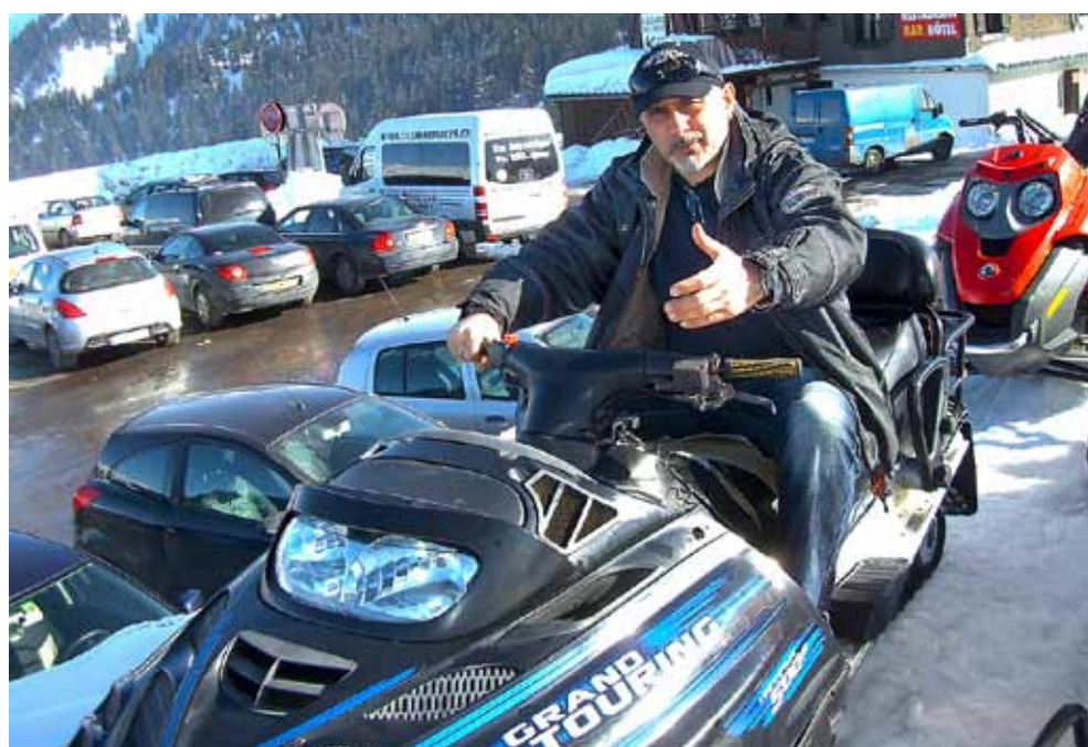
Le chef indique la voie à suivre.